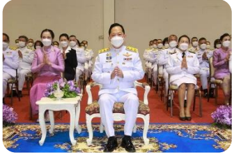
พิธีช่วงเช้า