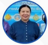
นางสุภาพรรณ หมั่นเจริญ รองผู้ว่าราชการจังหวัดเชียงราย