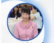
นางอุนลรัตน์ พวงกัญญา รองผู้ว่าราชการจังหวัดเชียงราย